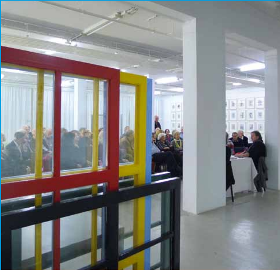
Debat in GEMAK