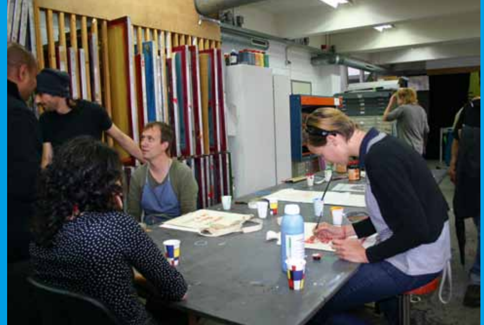
Workshop Fotografie & DNA-deelnemers aan de slag voor Open Dag