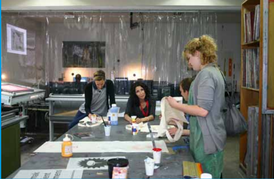
Open Dag ballonnen-project Werkplaatsen