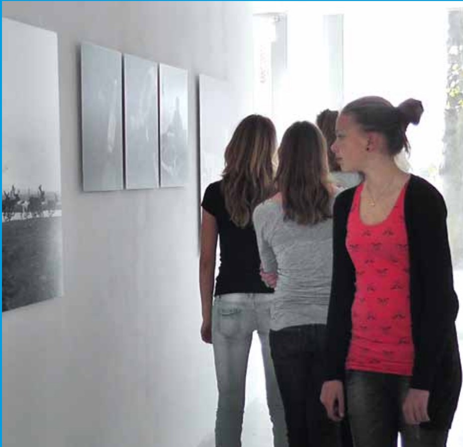
Educatieprogramma in GEMAK