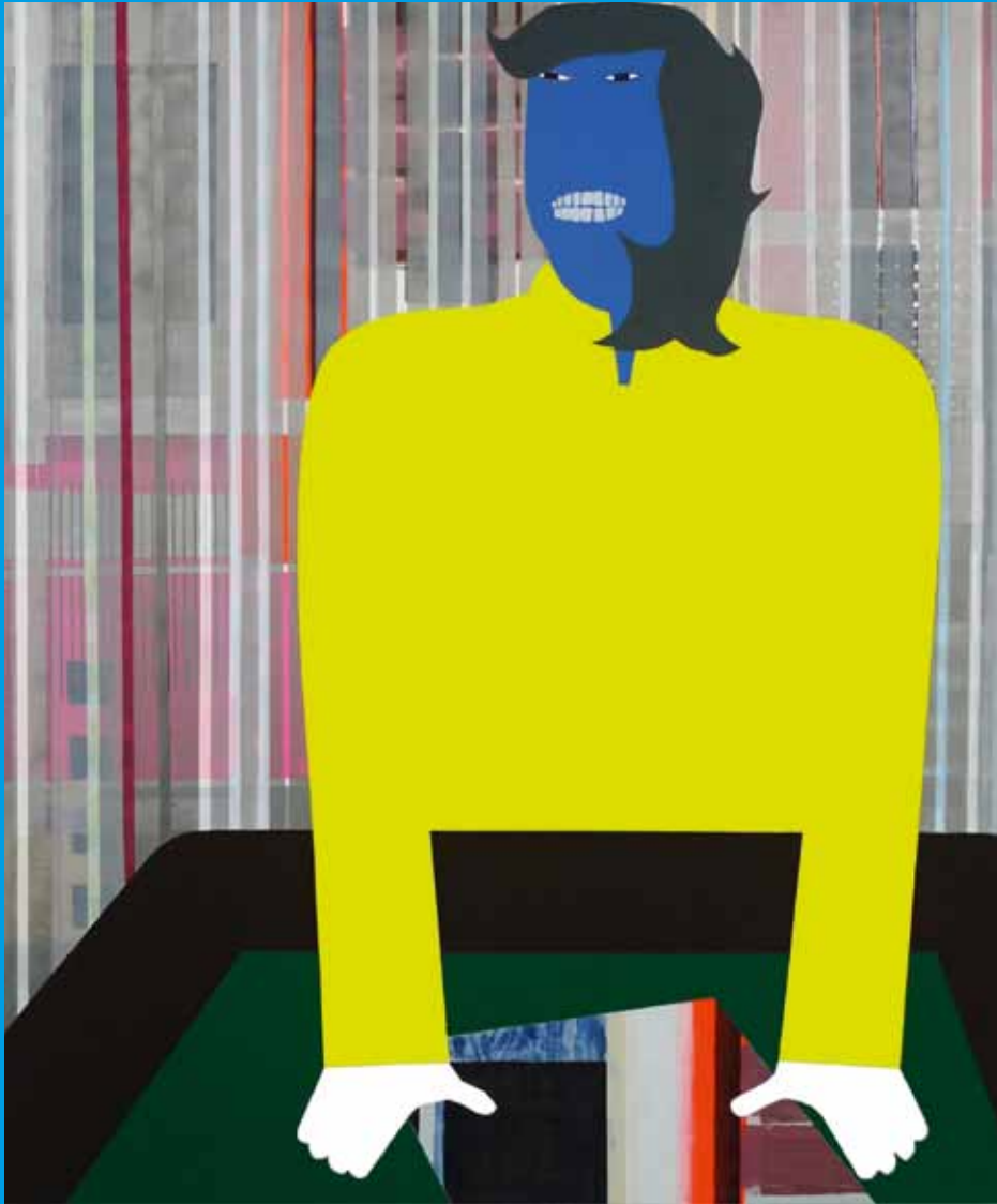
Anuli Croon: z.t. - gele trui, 180x150cm (2010) Anuli Croon is nieuwe begeleider 2D (Grafiek) voorjaar 2012