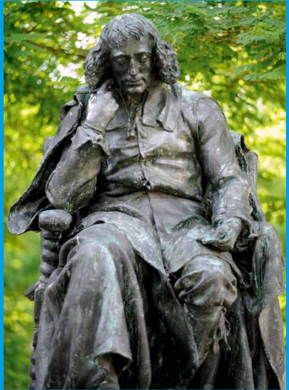
Standbeeld van Spinoza, vlakbij de Vrije Academie aan de Paviljoensgracht voor het Spinozahuis; Spinoza is een van de filosofen die centraal staan in het Studium Generale programma voorjaar 2012