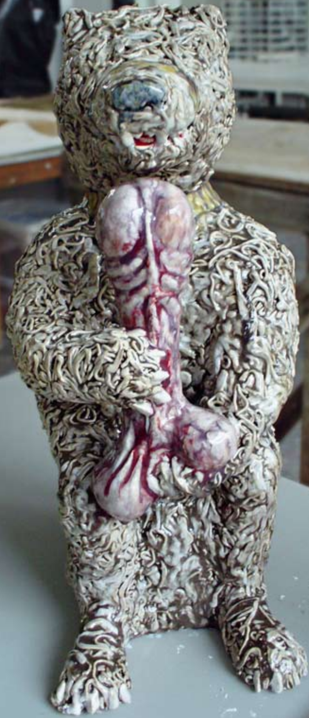
Artist-in-Residence project keramiek: werk van Gijs Assmann